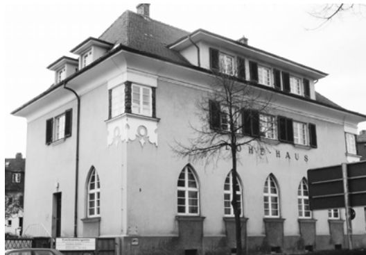
Lehrküche, Töpferstube und Kursräume, Löhehaus, Bismarckstr. 3