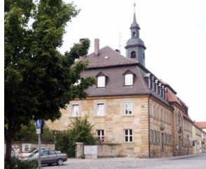
Treffpunkt St. Georgen, St. Georgen 1