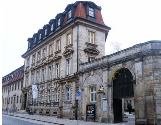
Anmeldebüro und Kursräume, Storchenhaus, Ludwigstr. 29

Familien-Bildung plus Mehrgenerationenhaus