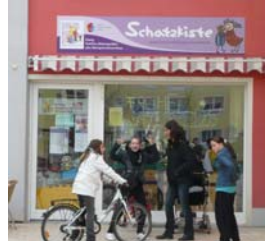
Familientreff „Schatzkiste“ Menzelplatz 8, Altstadt